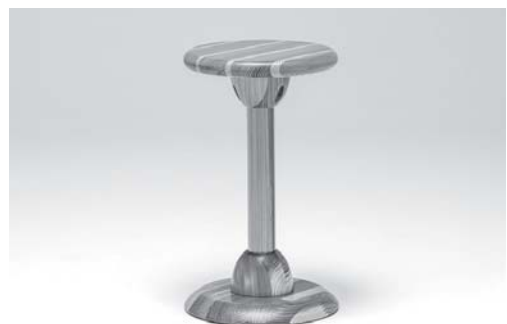
アキタコレクションのスツール