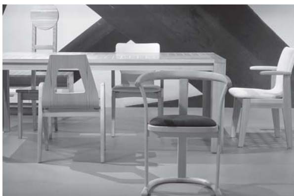
出品したテーブルと椅子（2018年HOMI）

これら家具は別々の製造者による為、生産性や加工法が異なり、生産が1か月に1個ないし2、3個だけと、グローバル展開を視野に入れたビジネスとしては課題があった。アキタコレクションとしての生産性を上げるため、2017年に製造グループに1社が加わる11社体制の中で、同じ家具を異なるメーカーが作れるよう加工法やスキルを検討・調整し、現在は各製品につき月産20～100個を可能とする協業体制の構築を進めている。深い職人連帯、企業連携は世界を相手に戦う大切なスキームである。