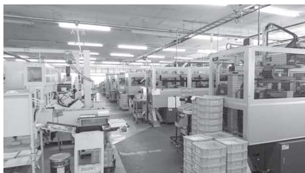
【第二工場:切削・研磨設備】