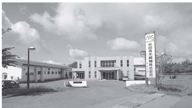
【本社工場・事務所】

現在主力製品であるターボシャフトにおいては世界生産シェアの1/3以上を堅持しており、世界のターボチャージャーメーカーに部品を供給しています。