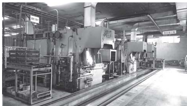
【本社工場:熱処理設備】

幸い当社は、素材から完成品まで社内で一貫生産を続けてきたことから、熱処理、切削、研磨の技術において蓄積があります。特に金属加工においては、これらの工程は避けて通れないものであり、次の展開にも活用できるものです。